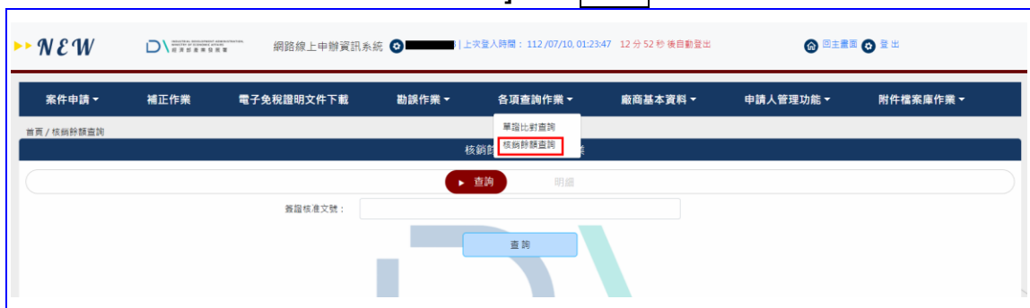
【圖表 1】核銷餘額查詢作業