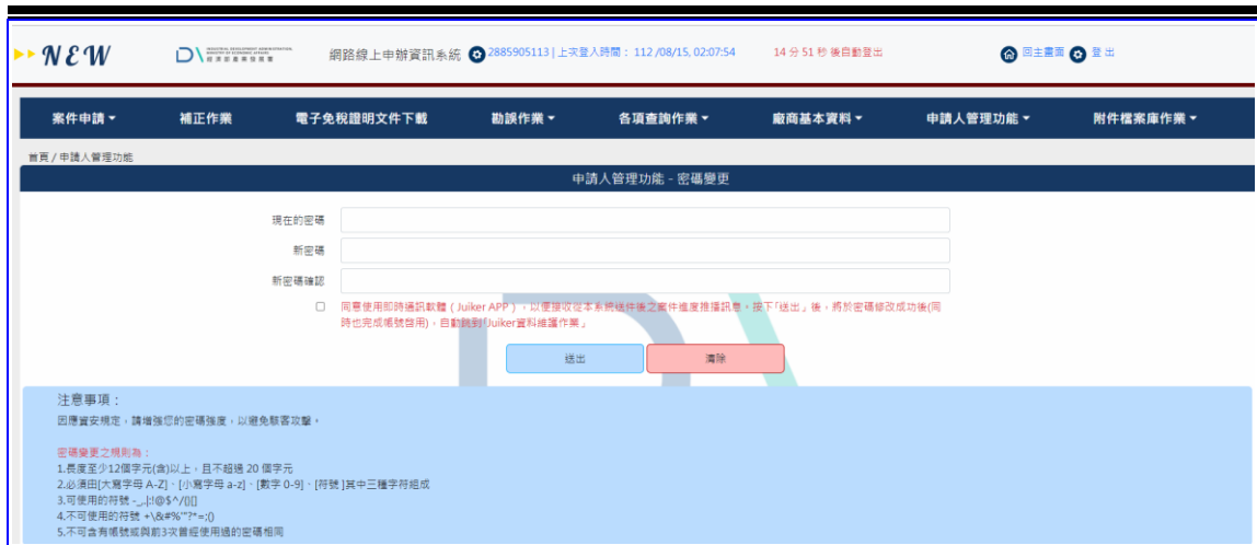
【圖表 5】非憑證帳號密碼修改作業