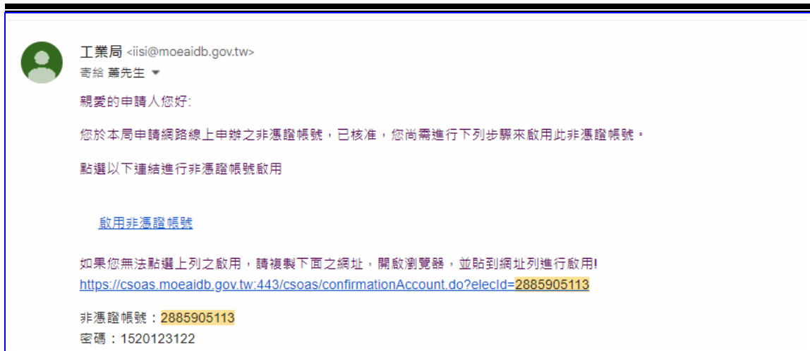
【圖表 2】帳號啟動電子郵件