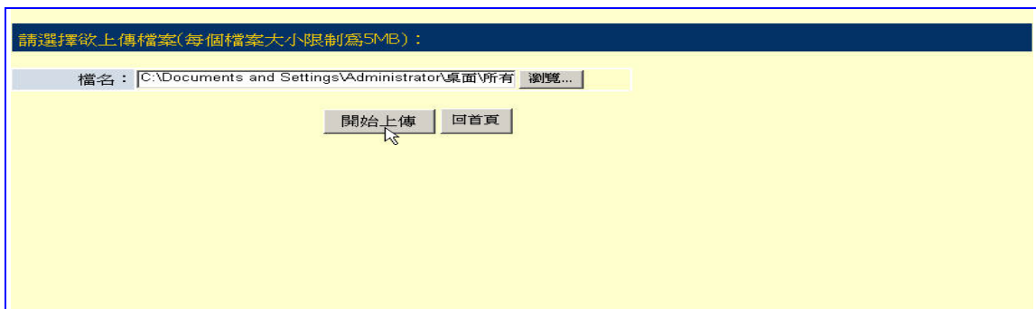
【圖表 24】選擇上傳檔案